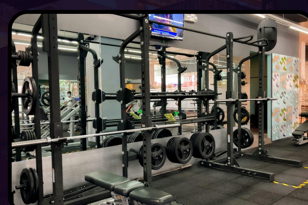
Equipamentos de academia